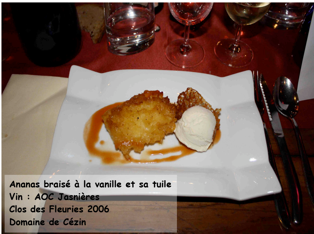
Ananas braisé à la vanille et sa tuile Vin : AOC Jasnières Clos des Fleuries 2006 Domaine de Cézin