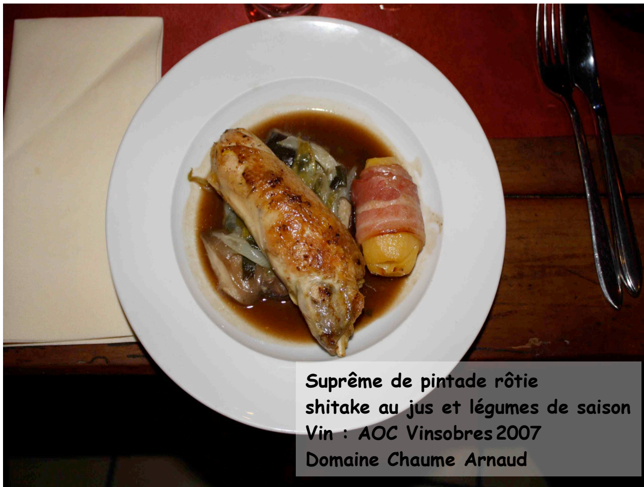
Suprême de pintade rôtie shitake au jus et légumes de saison Vin : AOC Vinsobres 2007 Domaine Chaume Arnaud